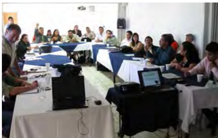
Taller ROAVIS-Guatemala- junio 2012