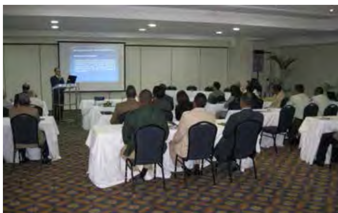
Taller ROAVIS República Dominicana