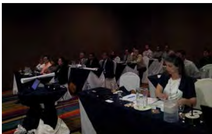
Taller ROAVIS El Salvador