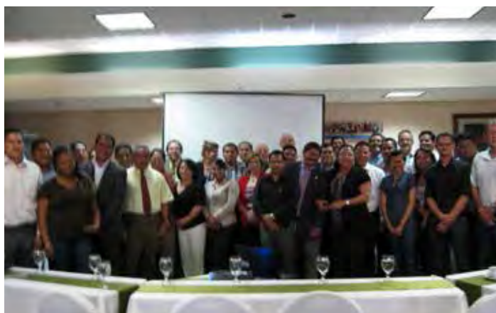
Participantes al Taller Nacional ROAVIS - Honduras Junio 2012