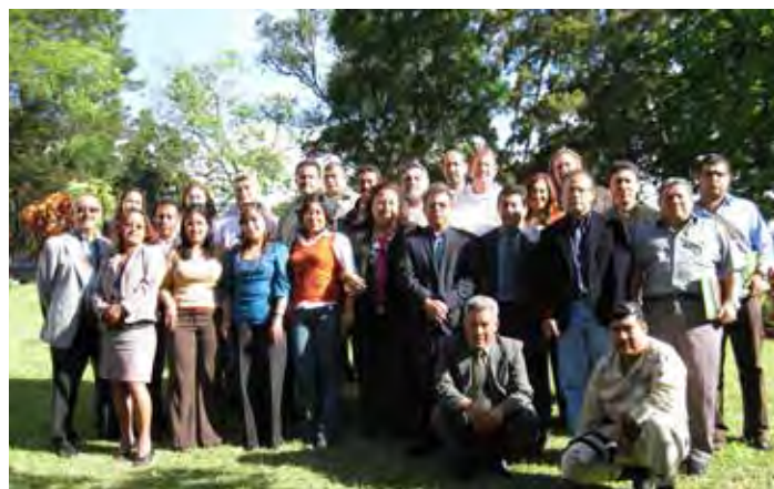
Taller Nacional ROAVIS-Guatemala Junio 2012