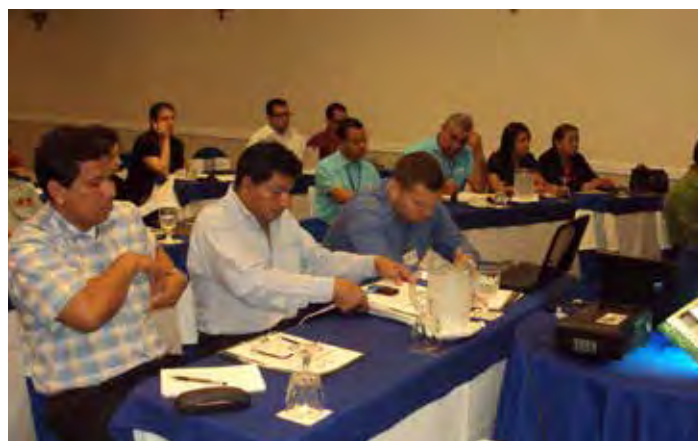
Taller ROAVIS Nicaragua