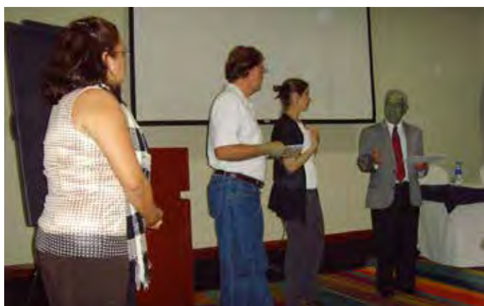
Taller ROAVIS El Salvador