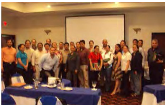
Taller ROAVIS Nicaragua