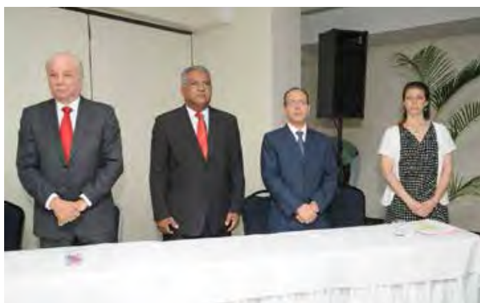
Taller ROAVIS República Dominicana