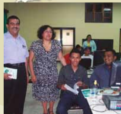
Un capacitador de DOI con un oficial Hondureño de Interpol.

DOI se asoció con la Secretaría de CITES para desarrollar un currículo dinámico e interactivo, especialmente diseñado para la región de Centroamérica, el cual está disponible en la web en cualquier momento. Al dirigirse a los líderes entre las autoridades de CITES y la comunidad de la ley, el DOI y el Gobierno de Honduras juntos capacitaron a entrenadores quienes pueden transmitir este conocimiento a su plantilla actual y futura para mejora su sostenibilidad. Al desarrollar un plan de estudio pertinente, accesible e interactivo, DOI ayudó a asegurar que estos líderes se sintieran motivados a usarlo. A través del apoyo de DOI, Honduras está dando grandes pasos hacia una mejor protección de sus especies en peligro de extinción.