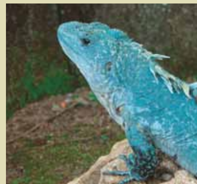
Ctenosaura bakeri, una especie en la lista de CITES endémica a Honduras.