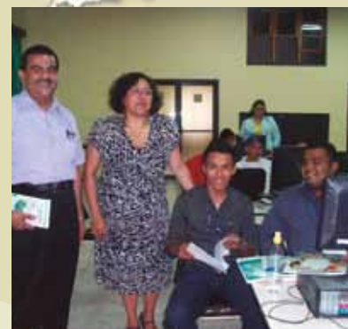
DOI trainer with Honduran and Interpol officials at CITES training

DOI partnered with the CITES Secretariat to develop a dynamic, interactive curriculum specifically designed for the Central America region and available on the web at any time. By targeting leaders among the CITES authorities and enforcement community, DOI and the Government of Honduras trained the trainers who can pass on this knowledge to their current and future staff, improving its sustainability. By developing a relevant, accessible, and inter-active curriculum, DOI helped ensure that these leaders will be motivated to use it. Through DOI support, Honduras is making great strides toward improved protection of its endangered species.